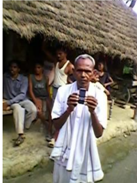
This is the first time Nokia has adopted villages in any